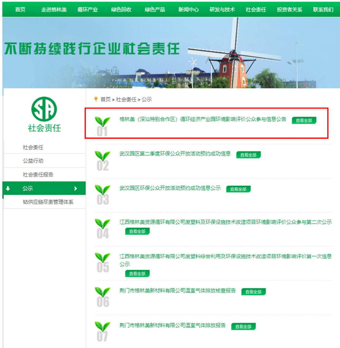
图 2-1 公众参与公告网站公示截图