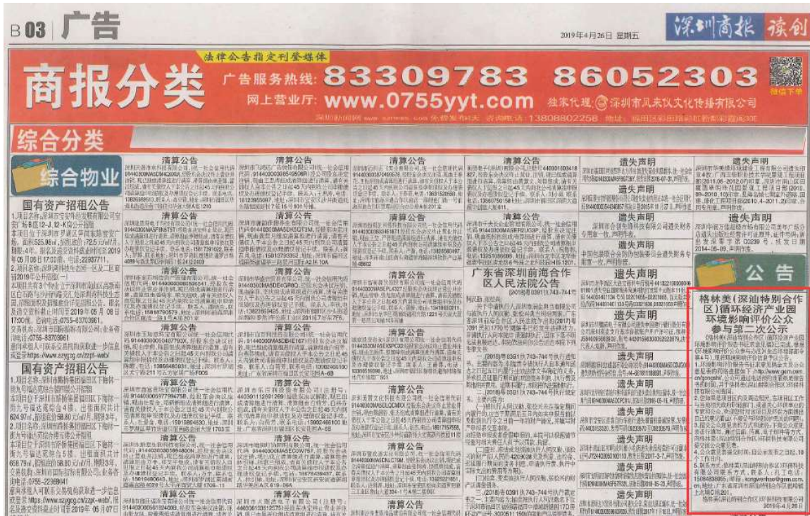
图 3-2 2019年4月26日深圳商报 B03 版面公示图