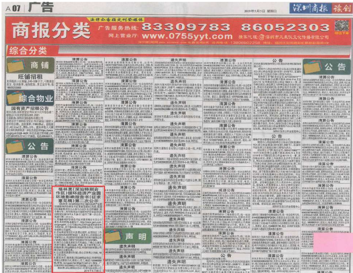
图 3-3 2019年5月5日深圳商报 A07 版面公示图